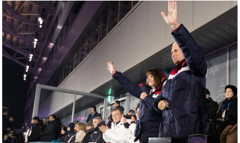
El vicepresidente Mike Pence y la señora Karen Pence asistieron a la ceremonia de apertura de las Olimpiadas de Invierno 2018 en el Estadio Olímpico de Pyeongchang, el viernes 9 de febrero de 2018, en Pyeongchang, Corea del Sur.

“En tanto que Estados Unidos y la Unión Soviética reconozcan que el avance de las facultades productivas del trabajo en todo el planeta es del interés vital de ambas, las dos potencias estarán vinculadas en