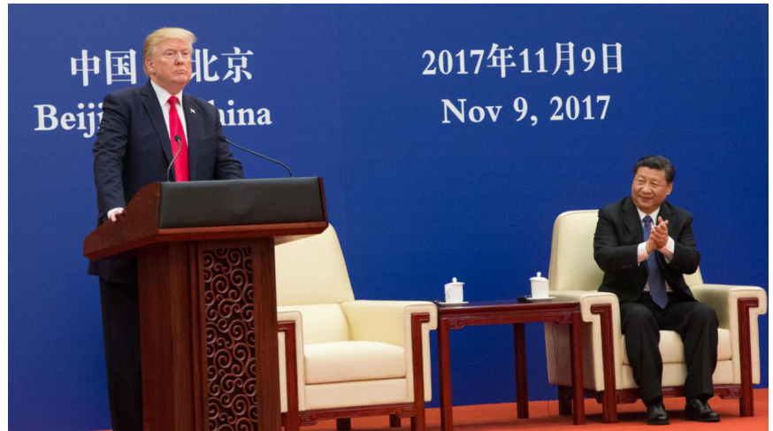
El Presidente Donald J. Trump participa en una reunión con el Presidente Xi Jinping en el Gran Salón del Pueblo, jueves 9 de noviembre de 2017, Pekín, República Popular de China.

El periodista Finian Cunningham escribió en RT un artículo sobre la Conferencia de Seguridad de Munich, donde capta la esencia de esto: “Que este caso tan superficial y frágil [los 13 rusos acusados