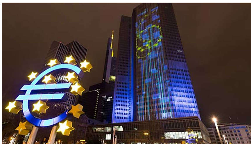
El Banco Central Europeo, en Francfort, Alemania.

¿Pero que sucede en estos “círculos financieros”? Están atragantados y sofocados con la “deuda chatarra” altamente especulativa de las corporaciones y también de los contratos con derivados financieros