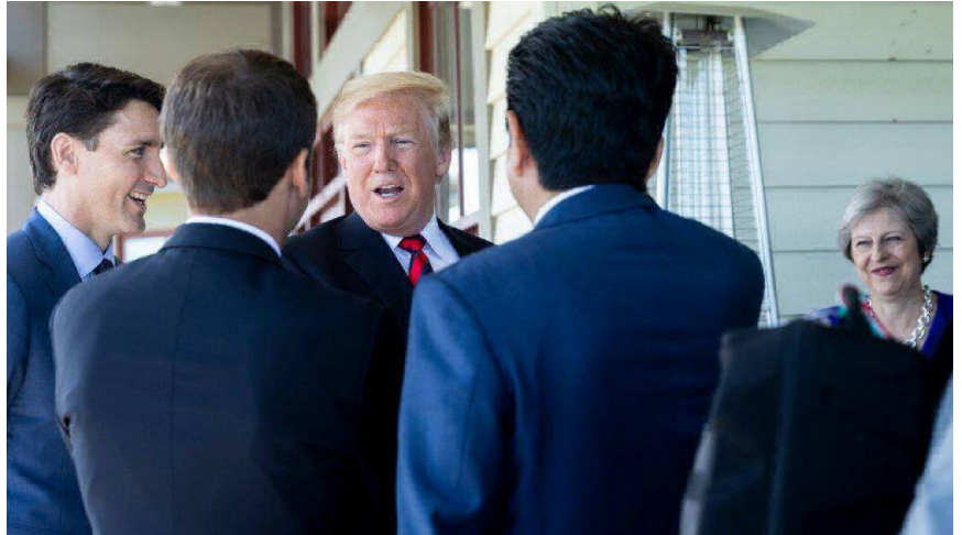
El Presidente Donald J. Trump conversa con sus colegas dirigentes del G-7, el primer ministro de Canadá, Justin Trudeau, el Presidente de Francia, Emmanuel Macron, el primer ministro de Japón, Shinzo Abe, y la primera ministra del Reino Unido, Theresa May, durante el Almuerzo de Trabajo del G7 en Canadá.

6) Las tensiones entre India y China están