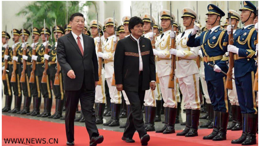
El Presidente de China, Xi Jinping, en la ceremonia de bienvenida al Presidente de Bolivia, Juan Evo Morales Ayma, en el Gran Salón del Pueblo, en Pekín, China, el 19 de junio de 2018. Xi Jinping sostuvo pláticas con Juan Evo Morales Ayma ese mismo martes.

Por otra parte, el gobierno japonés está trabajando los detalles sobre proyectos de cooperación con China por primera vez, en proyectos conjuntos en terceros países, en el marco de la Iniciativa de la Franja y la Ruta. El primer ministro Shinzo Abe habló esta semana de cómo puede Japón llevar a cabo su “exportación de