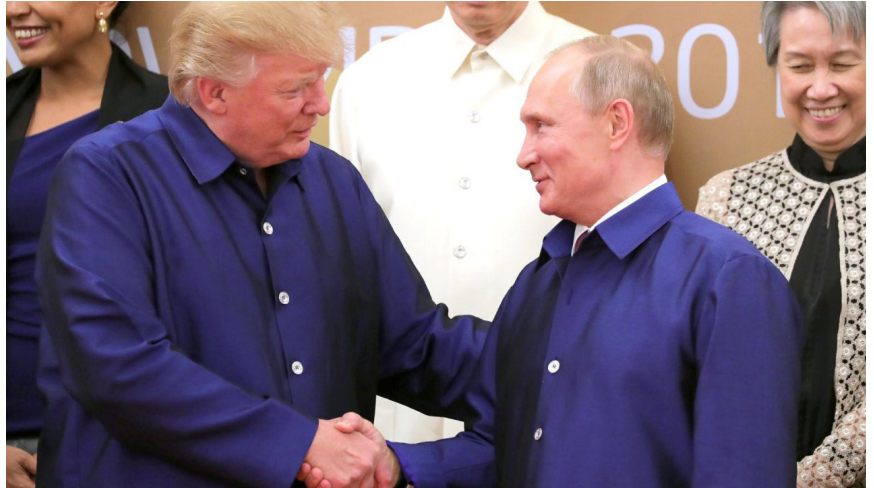
Los Presidentes Trump y Putin en su segunda reunión pública, durante la Reunión de Dirigentes de la Economía de la APEC. Vietnam, 10 de noviembre de 2017.

Hay muchas ironías en todo esto. En todo Estados Unidos, la izquierda liberal, considerada históricamente como la facción de la “paz” en Estados Unidos, servilmente ahora siguen la histeria dirigida por los británicos en contra de Trump, y exigen su salida, le dicen “fascista” y “racista”, y piden por todos lados que se hostigue día y noche a quienes trabajan con él o que lo apoyan, que se hostigue a sus hijos en sus escuelas, y así por el estilo. Quizás algunos de esos necios desorientados crean que esto tiene algo que ver