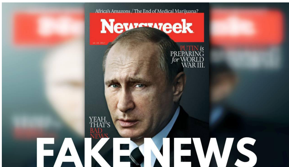
Portada de la revista Newsweek del 22 de diciembre de 2017 (Fair Use).

¿Psicosis? ¿Paranoia? Lo que está claro es que los británicos y sus piezas en Estados Unidos y Europa están histéricos por los esfuerzos del Presidente Trump para establecer relaciones amistosas con Rusia y con China. Para detenerlo, están tomando medidas para preparar a las poblaciones de Estados Unidos y de